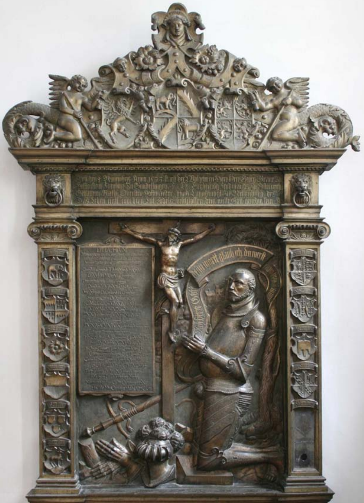
Grabmal Graf Georgs von Helfenstein in der Kirche von Neufra bei Riedlingen (1573).