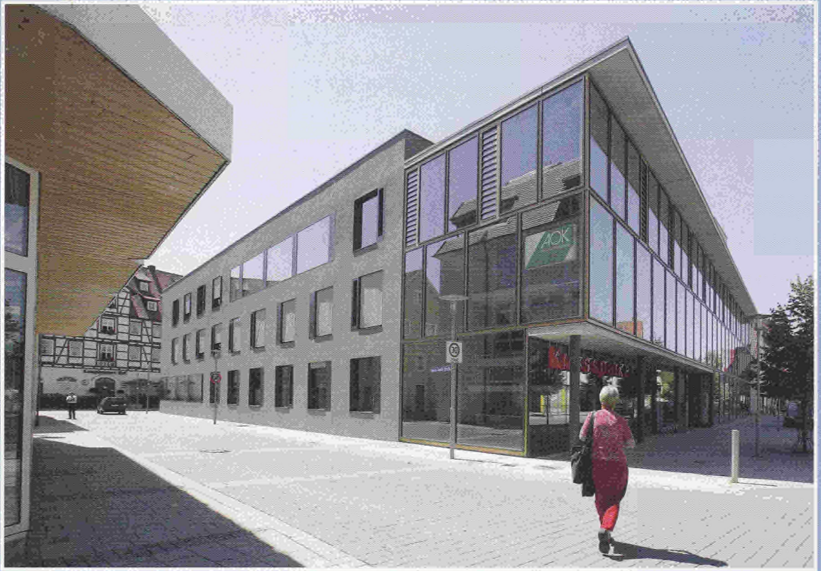
Die Geschäftsstellen Laupheim (oben) und Riedlingen (unten).