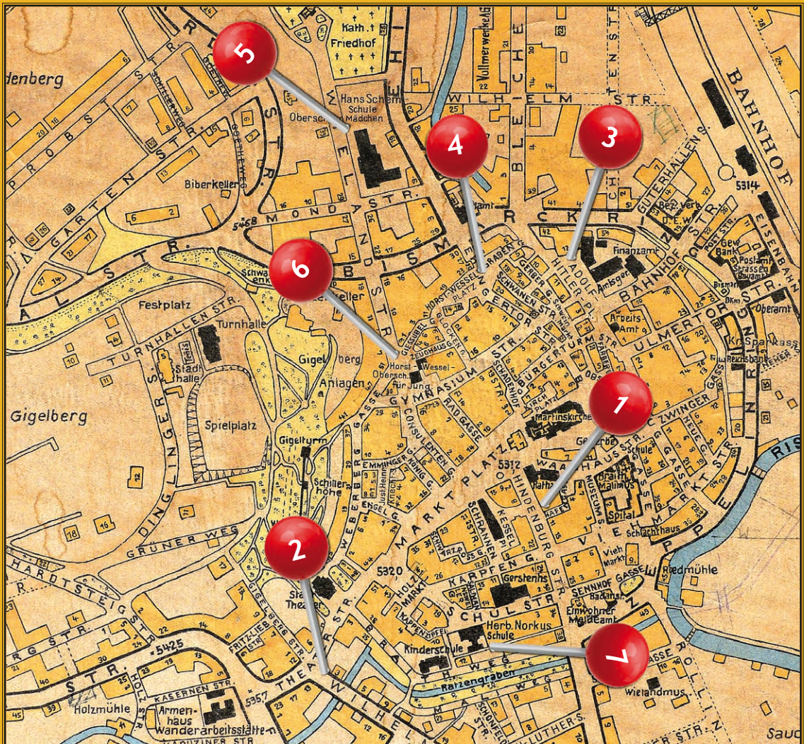
Plan von Biberach, bearbeitet vom Messungsamt Biberach im Jahre 1938. (Archiv Karl Seifert)

1. Die Kronenstraße wurde zur Hindenburgstraße . 2. Die heutige Kolpingstraße trug den Namen „ Wilhelm Neth “. 3. Der Alte Postplatz wurde zum „ Adolf-Hitler-Platz “. 4. Der Ehinger-Tor-Platz erhielt den Namen „ Horst-Wessel-Platz “. 5. Die Mädchen-Oberschule erhielt den Namen „ Hans Heinrich Georg Schemm “. 6. Die Oberschule für Jungen wurde zur „ Horst-Wessel-Oberschule “. 7. Die Biberacher Volksschule nannte sich „ Herbert-Norkus-Schule “.