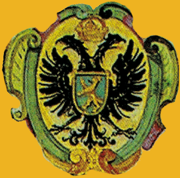
Freie Reichsstadt Biberach