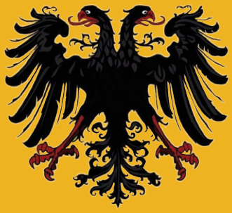
Heiliges Römisches Reich deutscher Nation